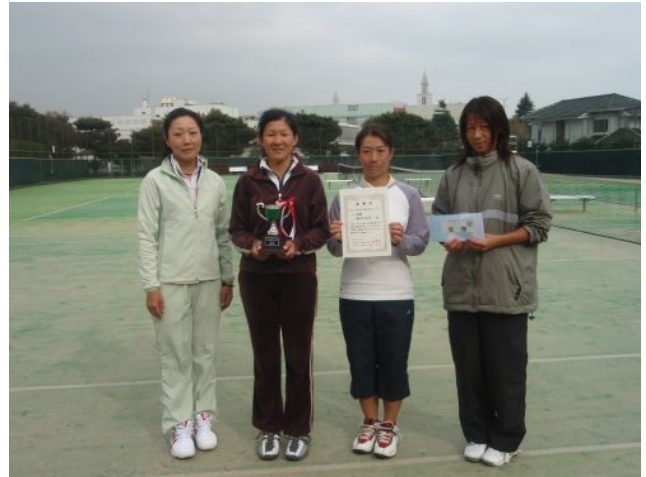
女子優勝 横浜市役所 (横浜市)