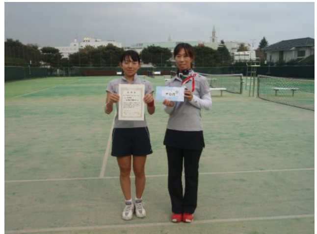
女子準優勝 三菱化学横総研 (横浜市)