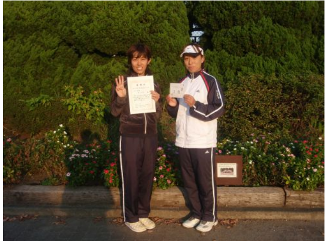
女子三位 アンリツ (厚木市)