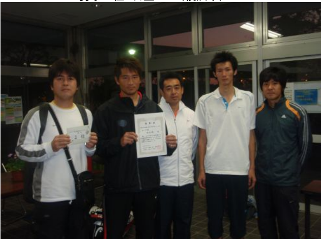
男子三位 日立SK (横浜市)