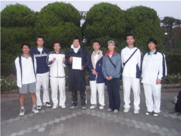
男子三位 NTT R&D (厚木市)