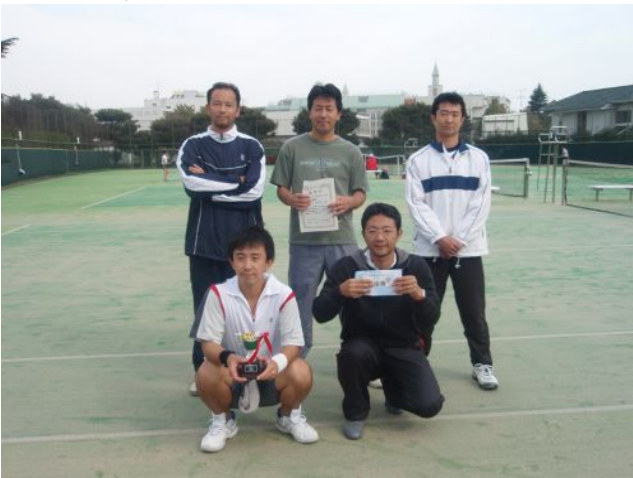
男子準優勝 第一三共PP (平塚市)