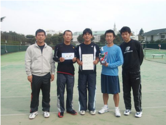
男子優勝 NOK (藤沢市)